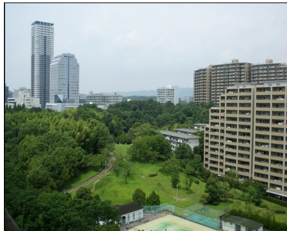
(緑多い安心・安全まちづくり「千里中央」)

地域をあげて「まちづくり」に取り組んでいる当事者の一人としては、落ち着いた緑多い街並みや、安心・安全まちづくりも評価基準に入れて頂ければありがたかったと考えます。